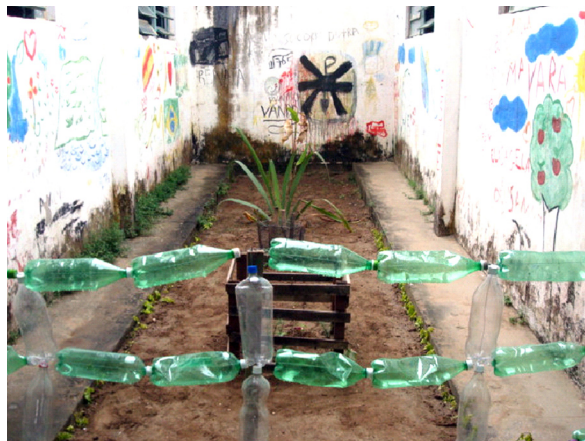
Imagem 11: Espaço revitalizado com arte em grafite e cerca de material reciclado